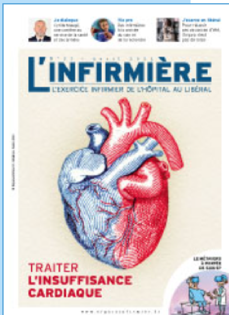
L'Infirmière n°31 - Avril 2023