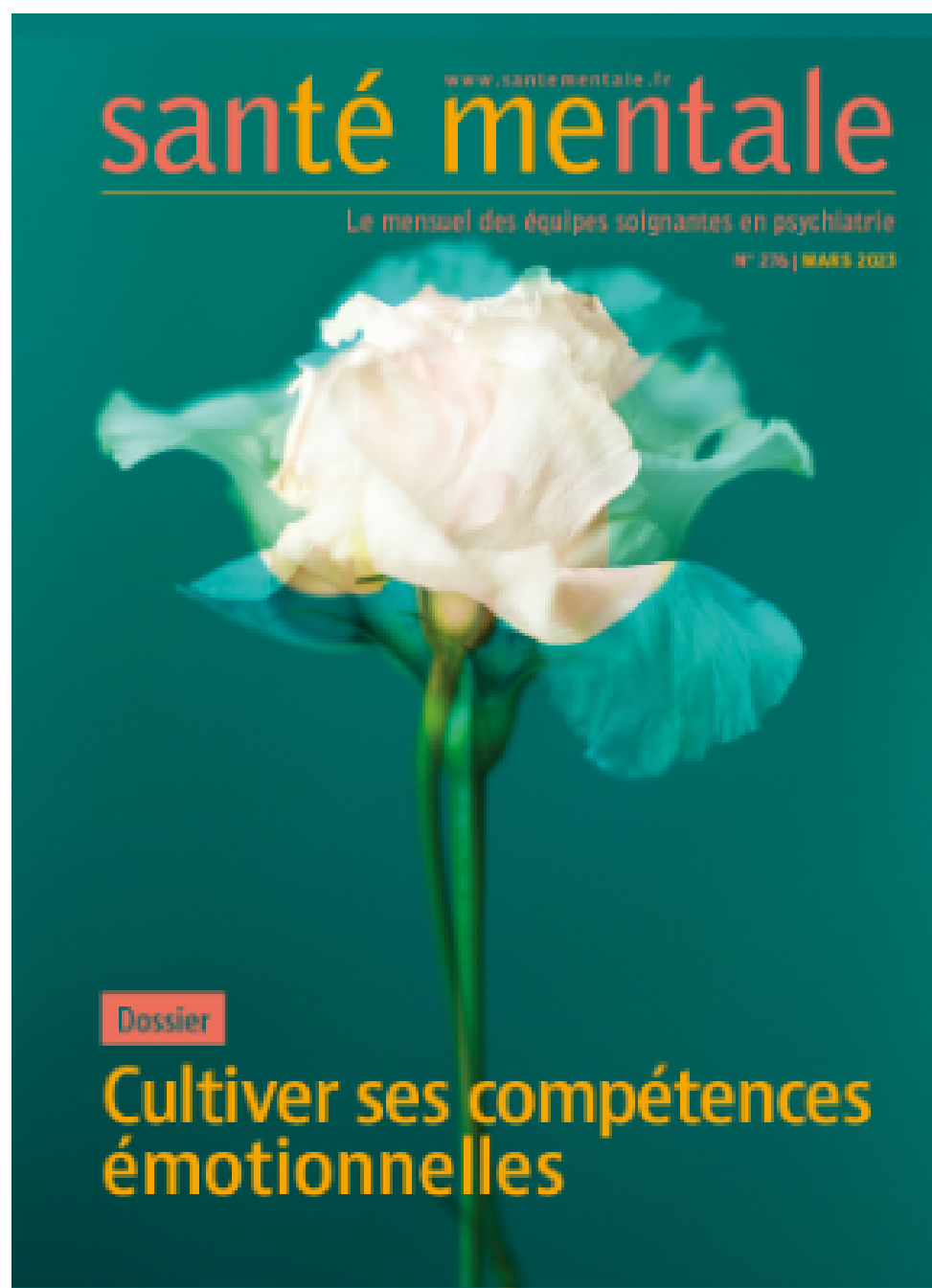
Santé mentale n°267 - Mars 2023

Dans son numéro de mars, Santé mentale propose un dossier sur l'émotion et la manière dont elle s'inscrit dans le prendre soin, à tous les niveaux.