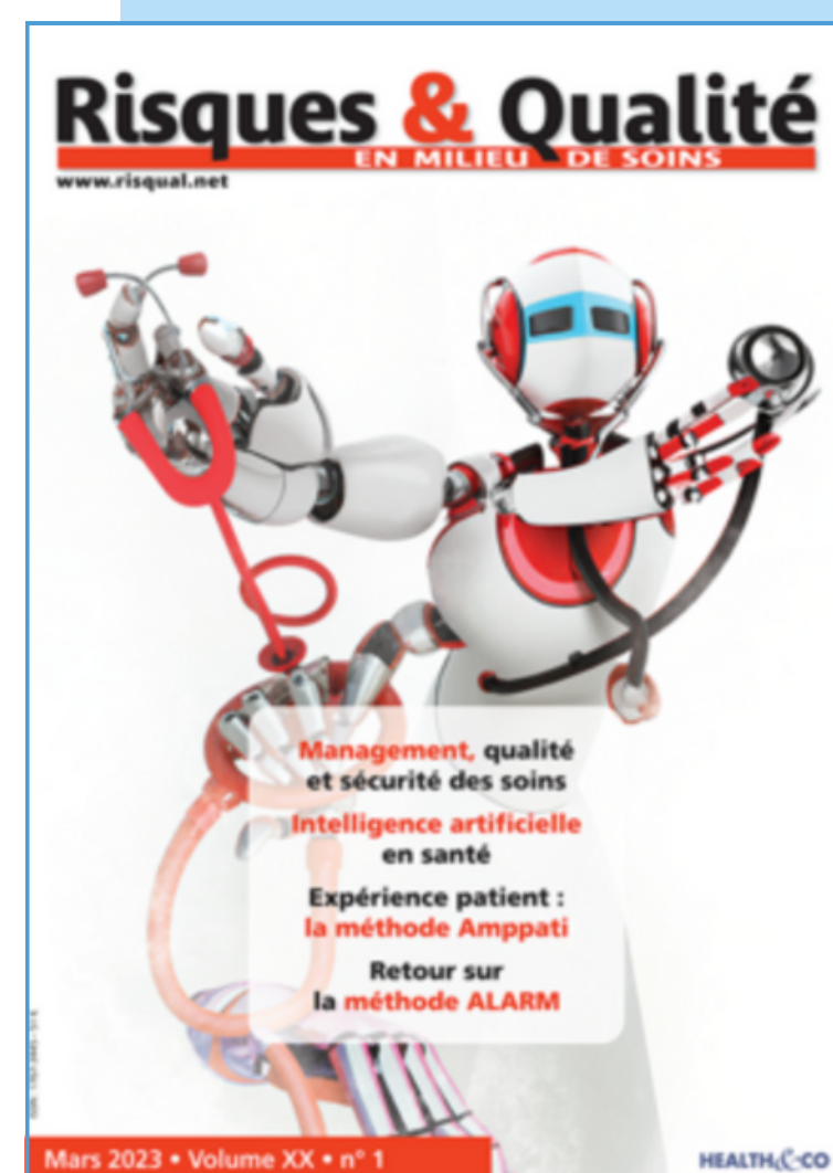
Risques & Qualité en milieu de soins Vol. XX n°1 - Mars 2023