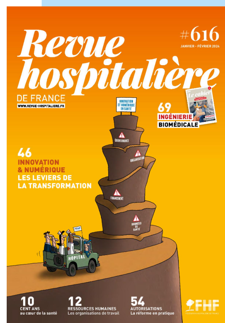
RHF n°616 - Janv.-Fév. 2024

Que ce soit à l'hôpital, ou pour des applications non-médicales mais liées au soin, les perspectives s'annoncent prometteuses pour les CHU de France. (p. 76-79)