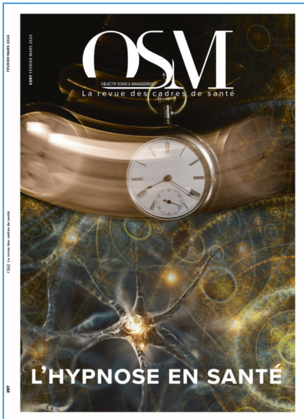
Objectif Soins & Management n°297 - Fév.-Mars 2024

Bien loin du côté spectaculaire d'un magicien qui endort un public entier et le fait se réveiller d'un claquement de doigts, l'hypnose telle qu'employée dans le domaine de la santé est une pratique à part entière. Utilisée pour réduire la douleur, l'anxiété et bien d'autres cas, elle nécessite une formation précise et continue.